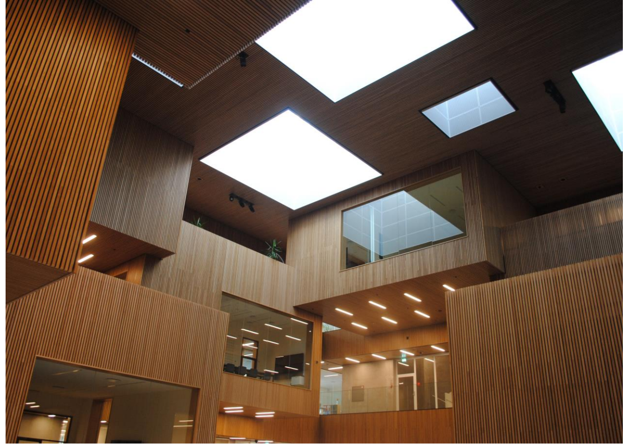
Et studie af materialer, farver og lys.