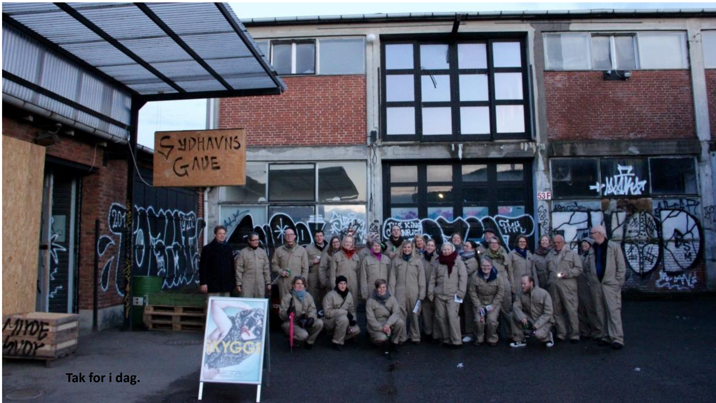
Tak for i dag.