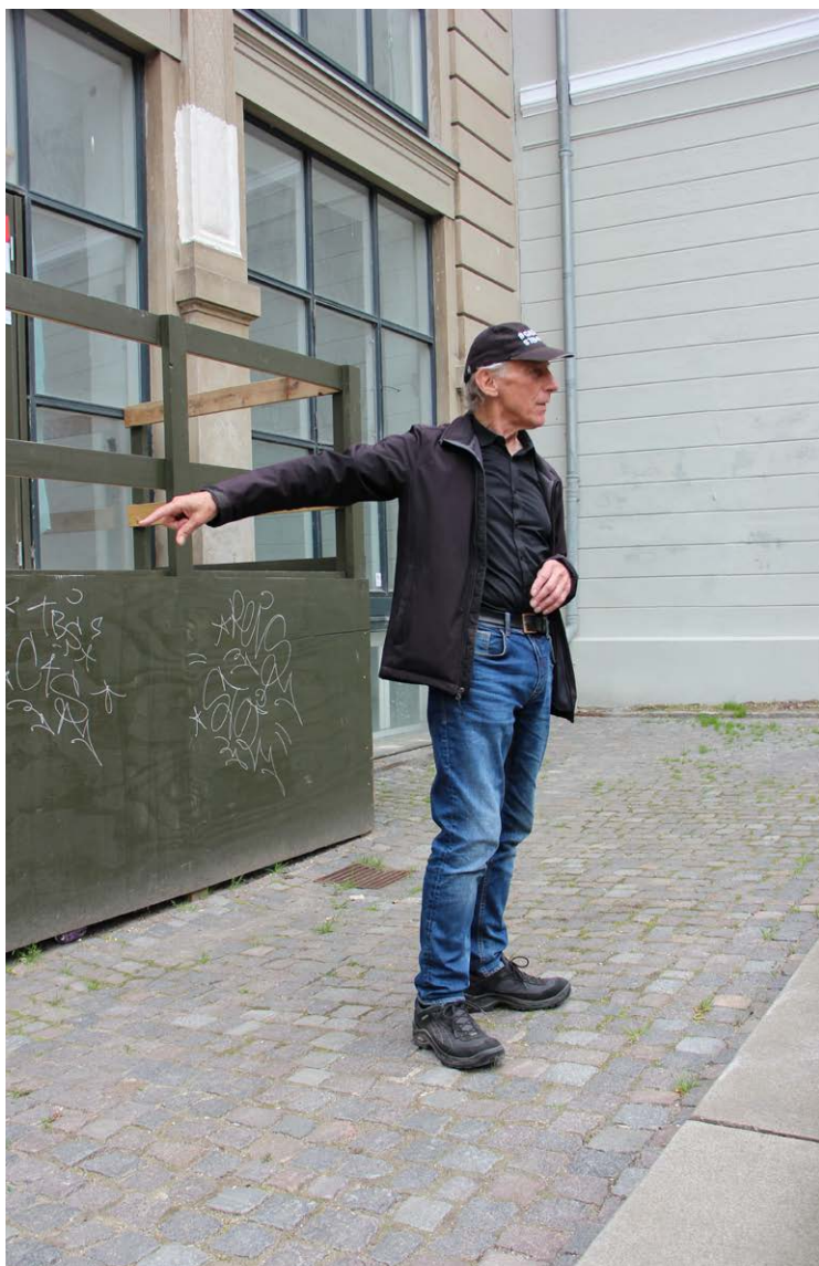
Steen har oplevet lidt af hvert fra risten ved Rundetårn, hvor han boede en tid.