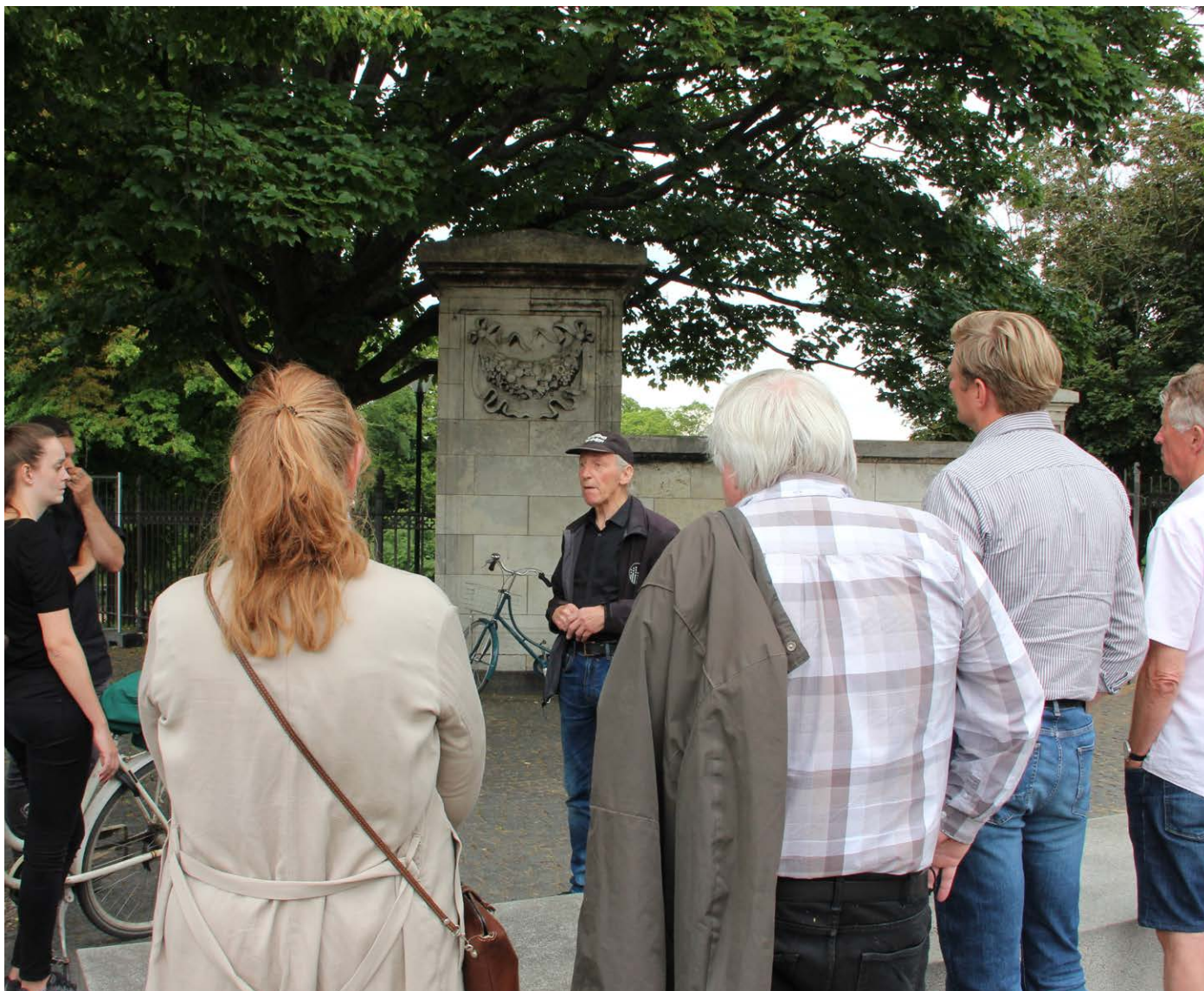
Steen fortalte sin historie om, hvordan han endte på gaden og om, hvordan en en ganske almindelig mand kan komme ud for ting, der kan vende op og ned på tilværelsen.