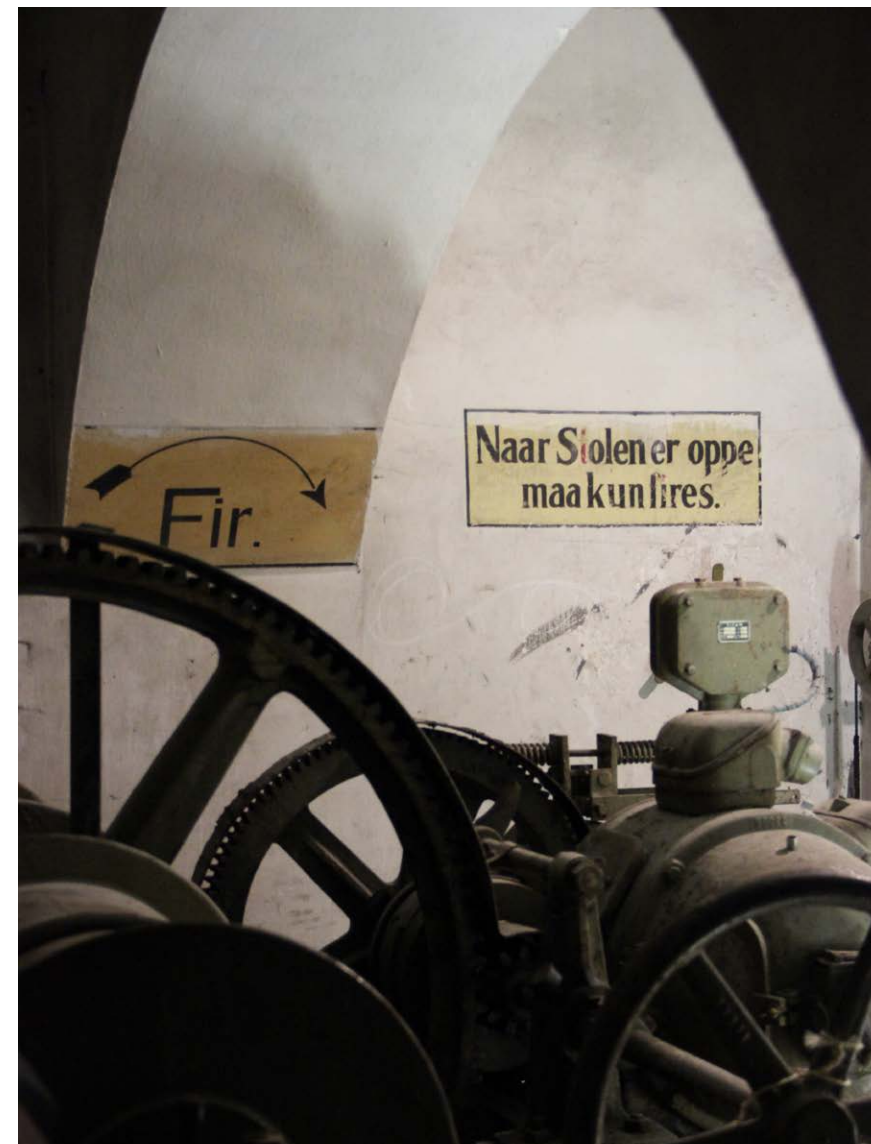
Dybt inde i gangene under jorden kan man støde på en gammel fængselscelle eller militært grej.