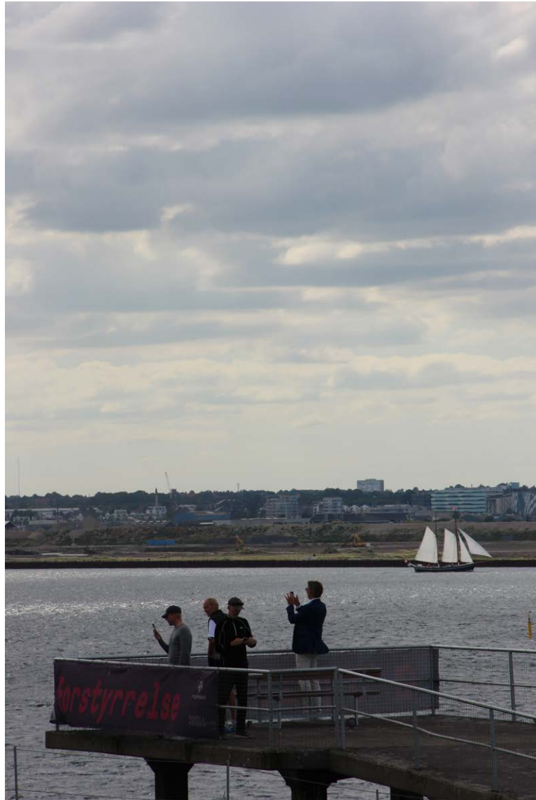
Øen ligger ikke mere end et stenkast fra Nordhavnen og der er flot udsigt til byen.