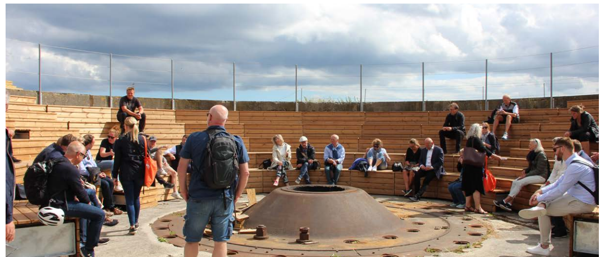
Den gamle kanon, der efter sigende kunne ryste hele øen, når den blev affyret, er blevet til et udendørs forsamlingssted med bålplads.