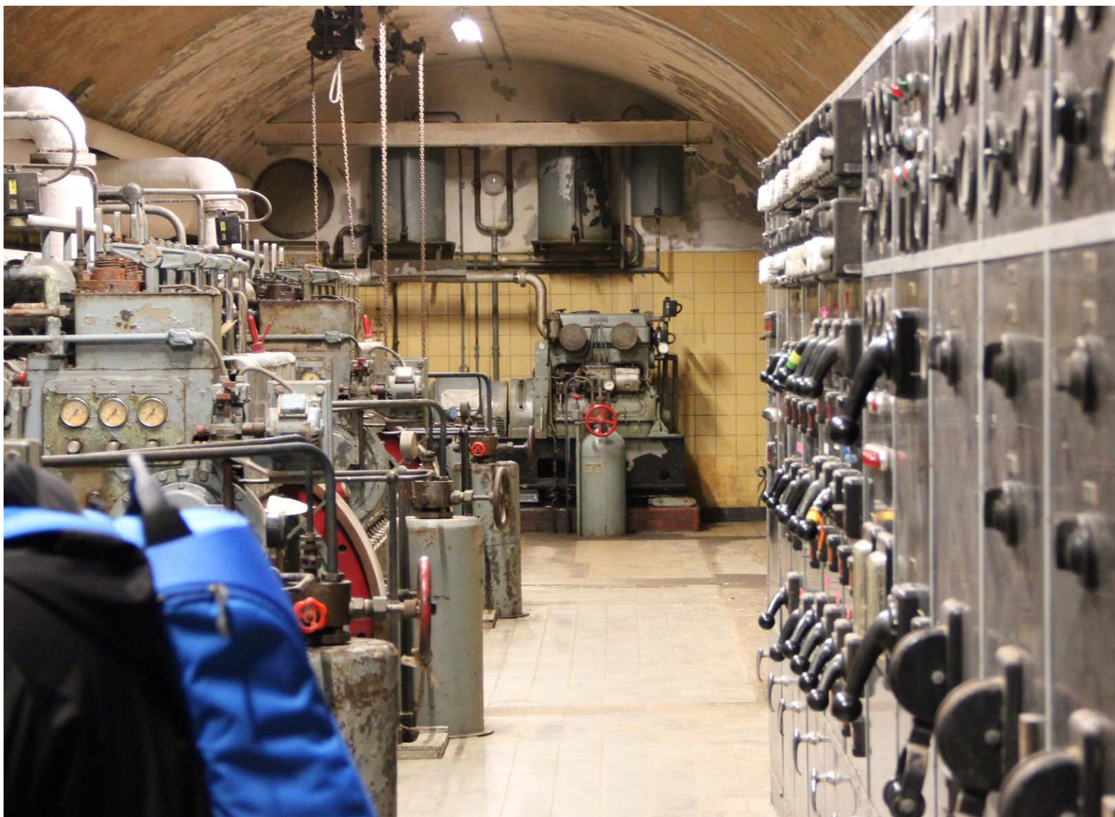
Generatoren fra B&W leverede strøm til hele øen, indtil den blev udskiftet af et mere moderne elanlæg. Rummet er bevaret og er, udover at være flot, med til at skabe atmosfæren i gangene.