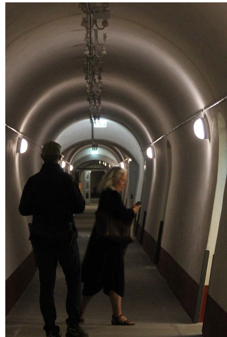
Det er nemt at fare vild i de mere end 2,5 kilometer gange, der gemmer sig under fortet.