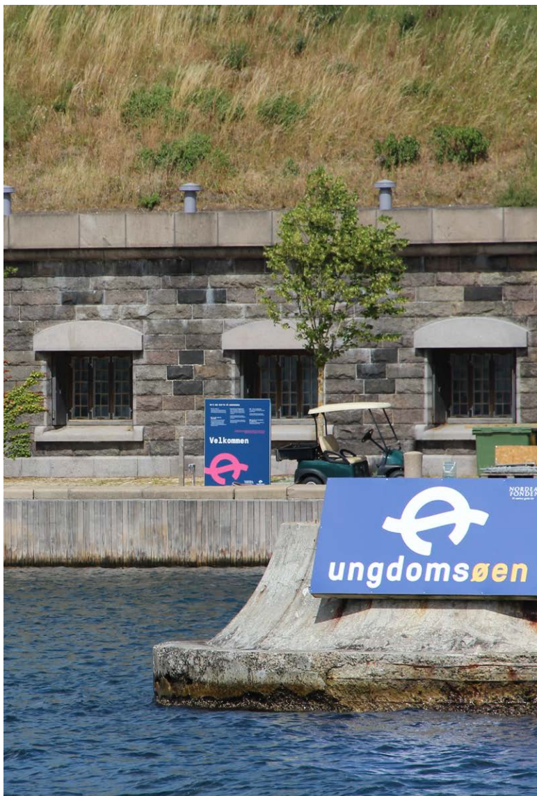
Man er ikke i tvivl om at man ankommer til en ø, der tilhører de unge, hvor voksne er gæster.