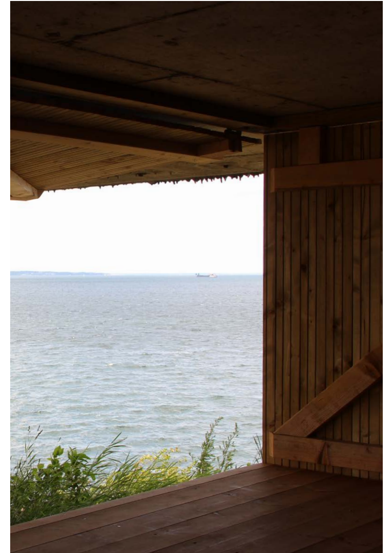
Under affyringsplatformene, hvor missilerne stadig peger mod himlen, er der lavet sheltere.