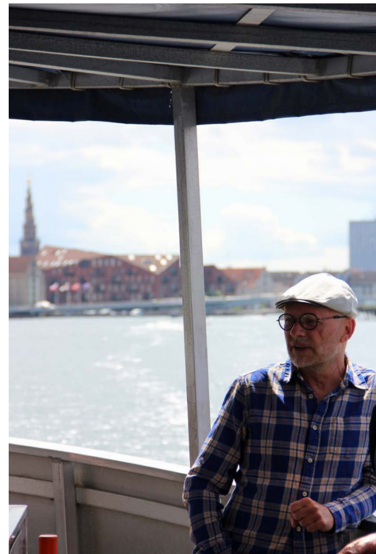
Båden til Ungdomsøen afgår flere gange dagligt fra Nyhavn, og er en flot sejltur ud ad byen.