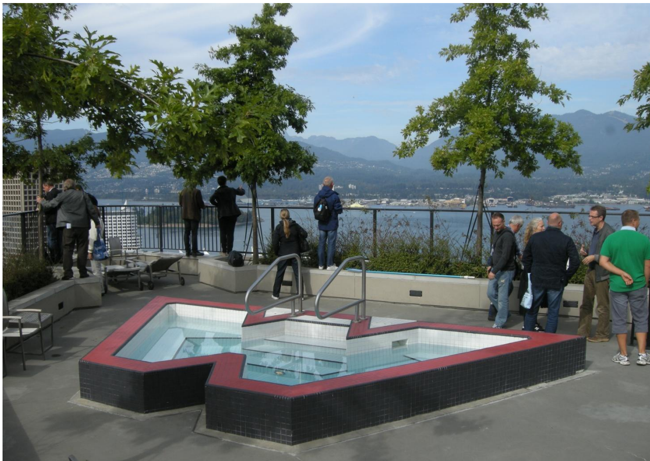
Foto 6 – Referencerne udnyttes flot – men også i stor stil – her er i form af siddepoolen på tagterrassen.