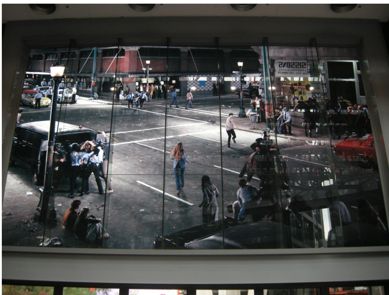
Foto 1 – Rekonstrueret foto af de gadekampe der blev vendepunktet for bydelen West Hastings.

Et kæmpefoto i bygningens "lobby" gengiver de gadekampe der var en milepæl i den sociale fornyelse af West Hastings, og vidner om modet til at fastholde udgangspunktet for opførelsen (foto 1).