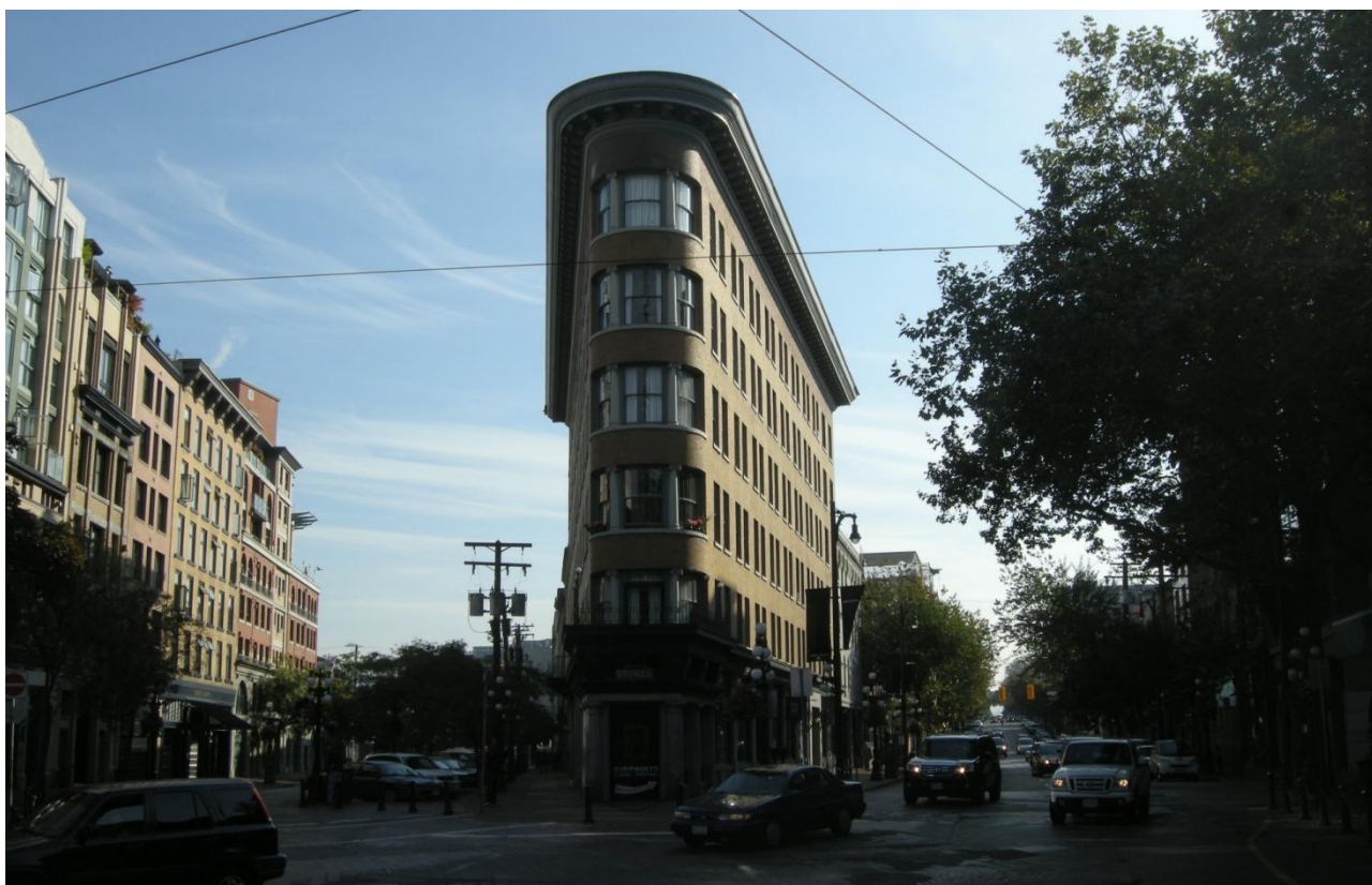
Foto 3 - Lokalt arkitektonisk værk, med inspiration fra Manhattans første højhus (Fuller Building).