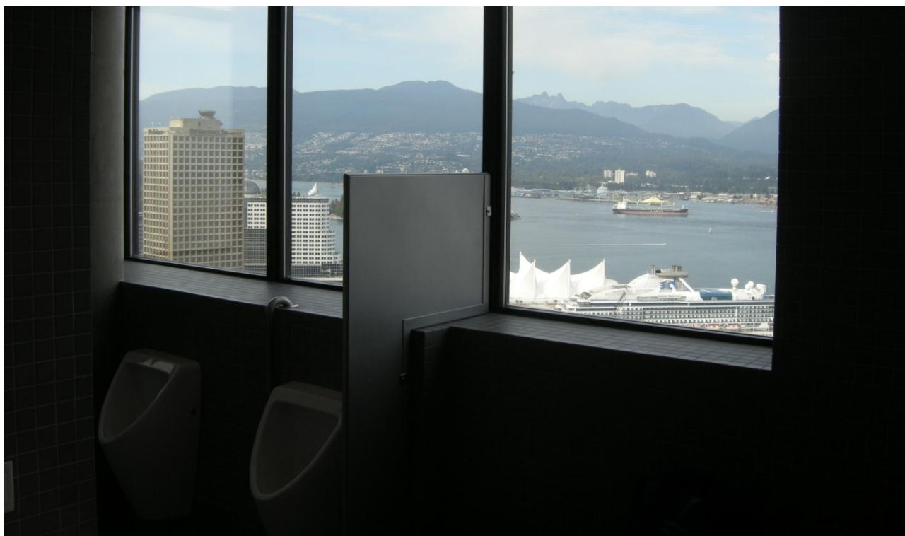
Foto 7 – "Man siger" at god arkitektur skal kendes på bygningens toiletter – så den skulle vel være hjemme!