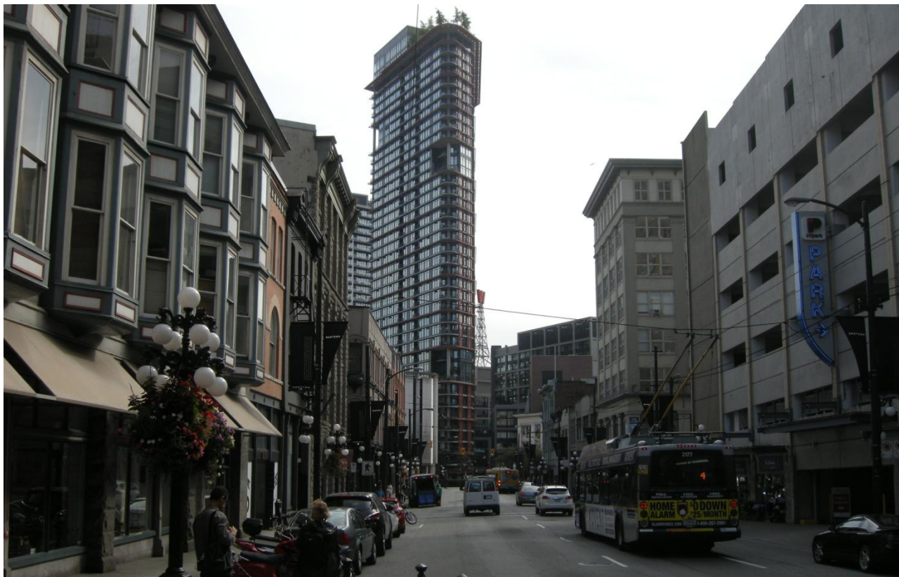
Foto 2 – Woodward's bygningen rejser sig som et lokalt vartegn i bydelen (bemærk "grønt på taget"!)