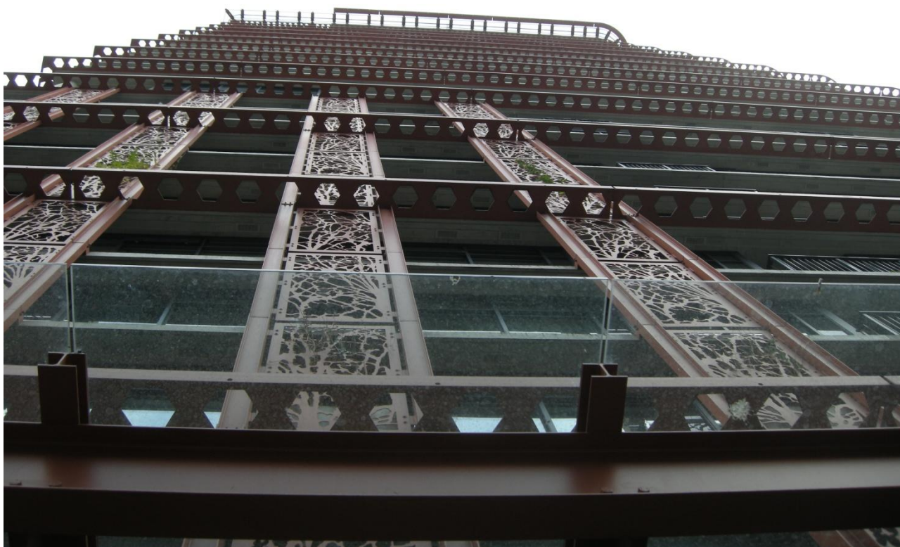
Foto 5 – Design og materialitet referer til europæisk modernisme samt Frank Lloyd Wright og Louis Kahn