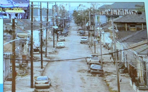
A typical Mid Town street after flood waters receded