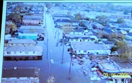
Mid Town was flooded with 6 to 8ft of storm surge