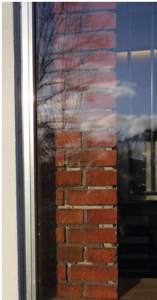
Vi inspicerer de fine detaljer i renoveringsarbejdet.