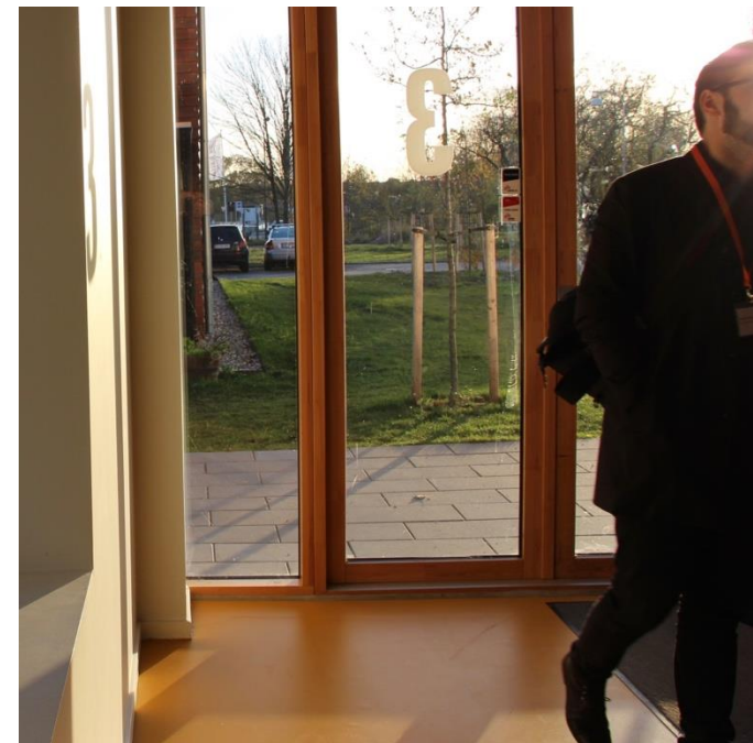
Sol- striber i den gule fløj.