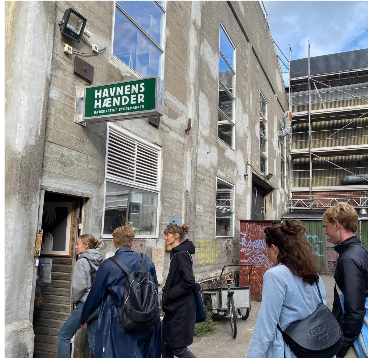
Havnens Hænder er Danmarks første bibaserede byggemarked. Bygningen på Refshaleøen huser både kontor, byggemarked, showroom samt workshopafdeling.