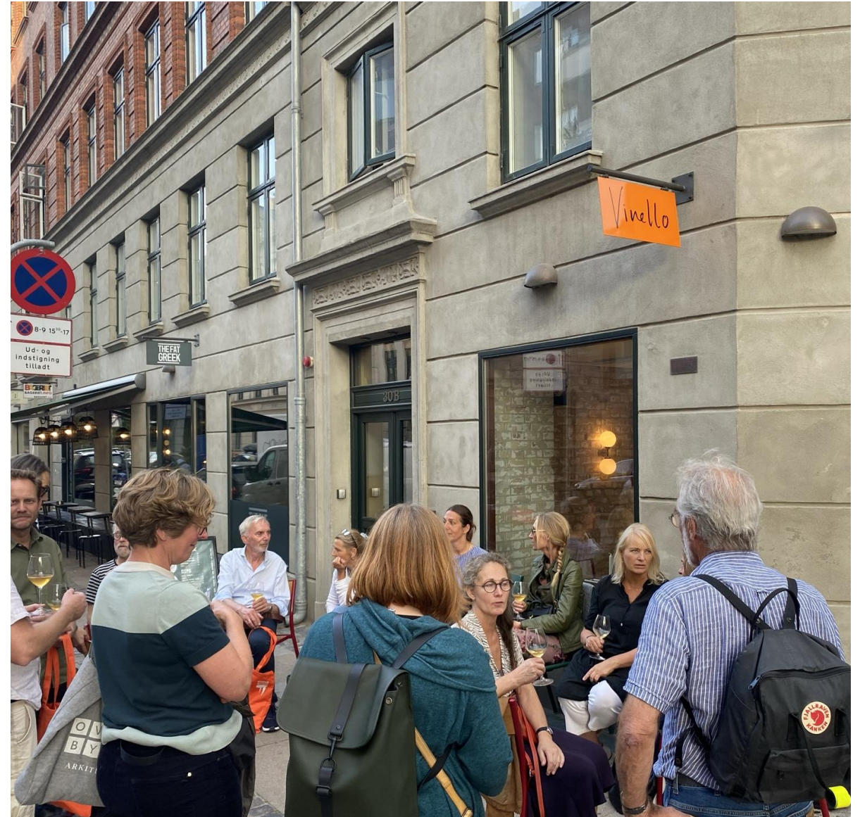
Vi sluttede besøget med et glas vin på den nyåbnede Vinello, der ligger i ejendommen Ryesgade 30, som holdet bag renoveringen af Ryesgade 25 renoverede i 2012.