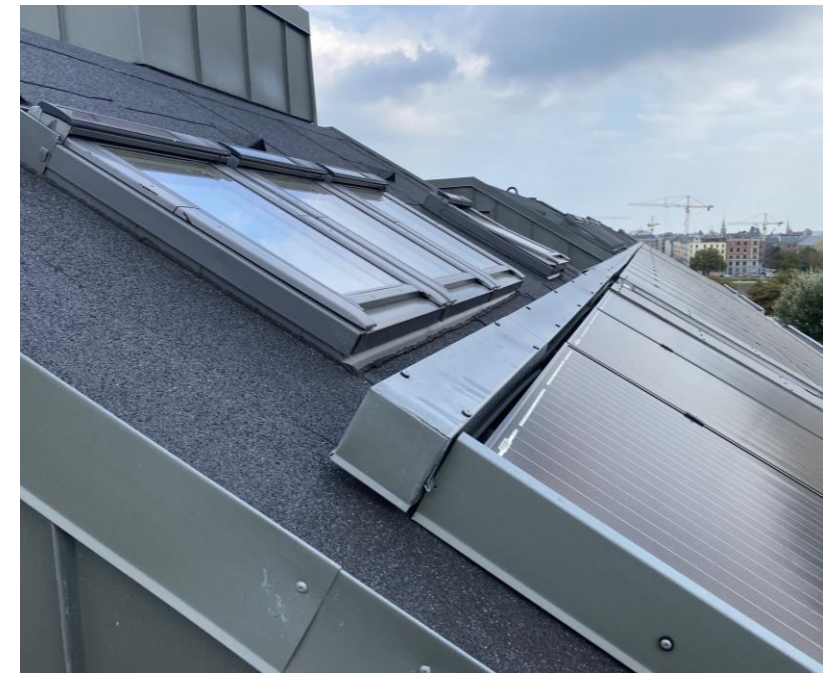
I renoveringen af Ryesgade 25 har der været fokus på at spare energi og forbedre indeklimaet med bl.a. nye vinduer, indvendig isolering, balanceret ventilation med varmegenvinding og nyt tag med solceller, der bidrager positivt til energiregnskabet.